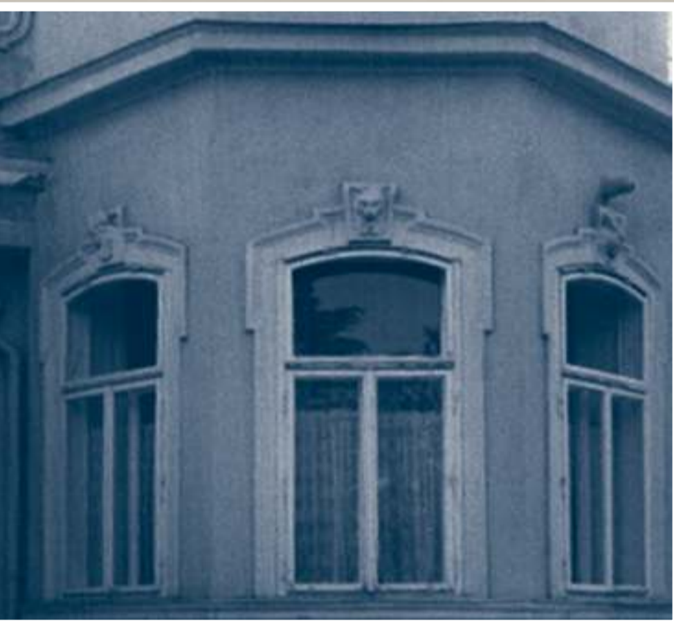
Eredeti állatfigurák a földszinti ablakok keretein.