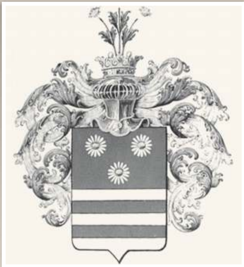
A Ferenc József adományozta Neumann-címer