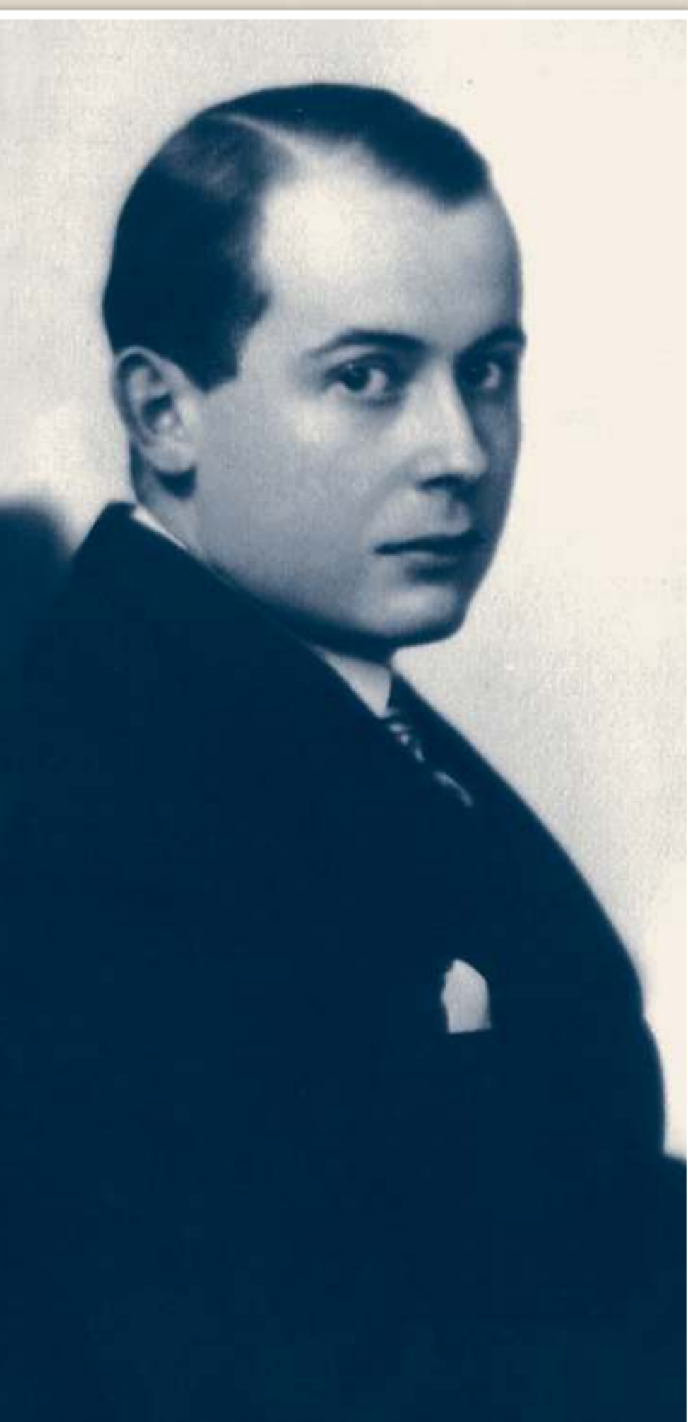
Neumann János érettségi képe

An industrious life, many nice wishes, Broken off from one day to the other, Hardly healed, new wounds occur, And the old set is getting ever smaller.